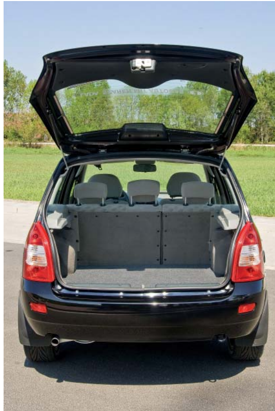
Große Klappe und auch was dahinter. Der Kalina löst die kleinen Transportprobleme des Alltags und wenn man die Rücksitzbank umlegt, auch die Größeren.

Im Gasbetrieb steht der Lada Kalina 1117 den Leistungswerten im Benzinbetrieb um nichts nach, selbst das Umschalten nach der Startphase verläuft im Gegensatz zu früher völlig ruckfrei und bleibt von Fahrer und Passagieren unbemerkt. Wer allerdings genau hinhört, könnte meinen, der Vierzylinder versieht seinen Dienst mit LPG eine Spur leiser als mit Benzin. Bei Lada-Fahrzeugen, die mit den Gasanlagen von Prins